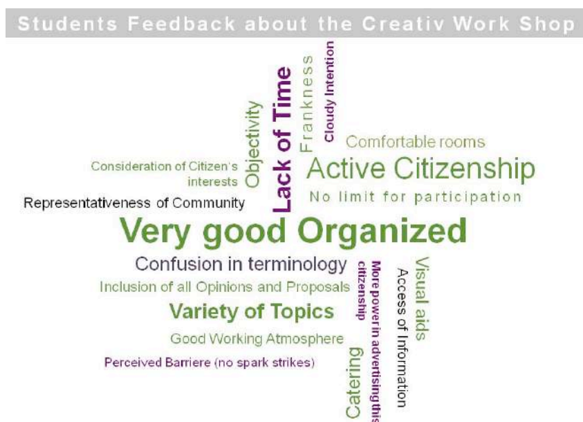
Figura 1. Ilustração da experiência do Curso de Oficina de Criação em Altona, em setembro de 2010, criada pela estudante Mutzek [tradução nossa].

O clima entre os cidadãos que participam ocasionalmente é muito negativo, e já existem iniciativas de alguns 1 contra o processo.