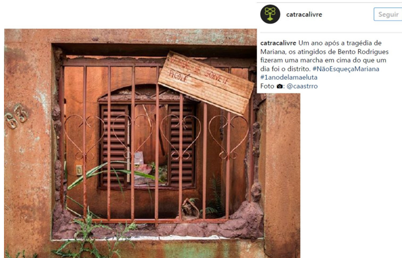
Fig. 9: Foto tirada em Bento Rodrigues e publicada pelo catracalivre no Instagram. Fonte: Matheus Castro, 2016. Disponível em: https://www.instagram.com/p/BMcqHG6gE21/?tagged=1anodelamaeluta . Acesso em: 27 abr. 2020.

Essas informações são fragmentos da reconstrução da memória social do desastre de Mariana, e, especialmente, são o exercício de contar uma história sobre a história de documentos acessados e produzidos através de duas hashtags que indexam memórias digitais sobre um mesmo evento.