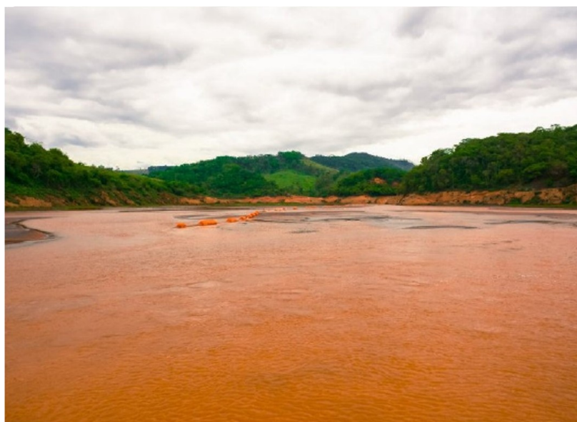
Fig. 8: Imagem capturada de publicação feita pelo MAB Nacional.