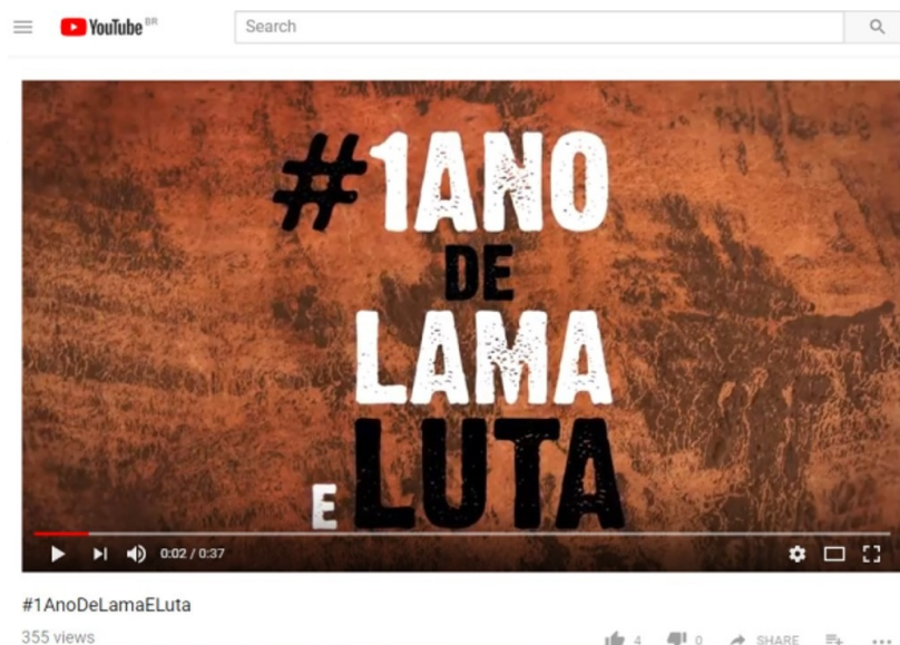
Fig. 5: Imagem capturada do vídeo publicado no Youtube em 27 de setembro de 2016.

Já quase um ano após o desastre, em 27 de setembro de 2016, um chamado foi publicado nas redes sociais com a seguinte mensagem: "#1ANODELAMAELUTA (Figura 5). O crime do Rio Doce jamais vai ser esquecido! 31/10 a 02/11 Marcha de Regência a Mariana. 03/11 a 05/11 Encontro dos Atingidos em Mariana. Lutar é organizar para os direitos conquistar" (#1ANODELAMAELUTA, 2016a). A publicação foi feita pelo MAB – Movimento dos Atingidos por Barragens, uma organização nacional cuja origem data do final da década de 1970.