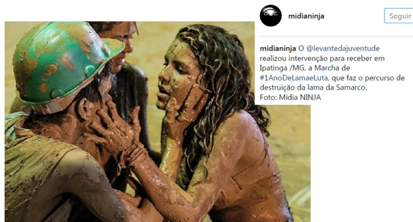
Fig. 6: Imagem capturada de publicação feita pelo midianinja no Instagram. Cena de uma intervenção para receber a Marcha de #1AnoDeLamaELuta em Ipatinga/MG. Fonte: Mídia Ninja, 2016. Disponível em: https://www.instagram.com/p/BMUhdWshQcc/?tagged=1anodelamaeluta . Acesso em: 27 abr. 2020.

Em 2 de novembro de 2016, um dia após o poema ganhar destaque na rede, o Mídia Ninja, uma rede livre de midiativismo, registrou outro tipo de manifestação artística. A Figura 6 mostra uma cena da intervenção realizada pelo Levante da Juventude na cidade de Ipatinga (MG), que recebia a "Marcha de #1AnoDeLamaELuta, que faz[ia] o percurso de destruição da lama da Samarco" (midianinja, TR 1, Item 13-3).