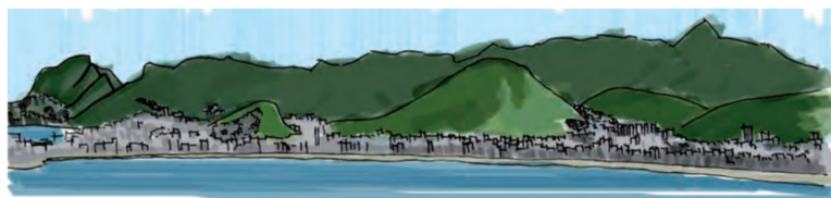
Fig. 4: Rio de Janeiro visto da Baía de Guanabara: desenho apresentado no dossiê. Fonte: Brasil (2011, p. 31).

A cidade é conhecida pela bela paisagem formada pela relação cidade-natureza, então é contraditória a não-utilização de fotografias. Mas, ao analisar os dados apresentados por Figueiredo e Chiuratto sobre a alteração do dossiê inicial, nota-se que as ilustrações permitiram minimizar a cidade e sobressaltar a natureza. Mais importante ainda, conseguiram excluir as favelas, escondendo uma realidade indesejada e tecendo uma imagem idealizada da cidade.