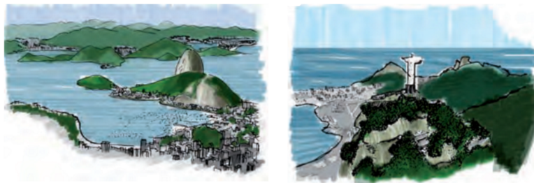
Fig. 3: Baía de Guanabara e Cristo Redentor: desenhos apresentados no dossiê.

Em 1º de julho de 2012, a cidade tornou-se a primeira do mundo a receber o título de Paisagem Cultural pela UNESCO, com o dossiê "Rio de Janeiro: paisagens cariocas entre a montanha e o mar". Um documento que intriga por ser composto quase exclusivamente de áreas naturais, excluindo não só a população, mas a própria cidade do patrimônio reconhecido. Também chama atenção o fato de que os bens são retratados por ilustrações e não fotografias (Fig. 3 e 4).