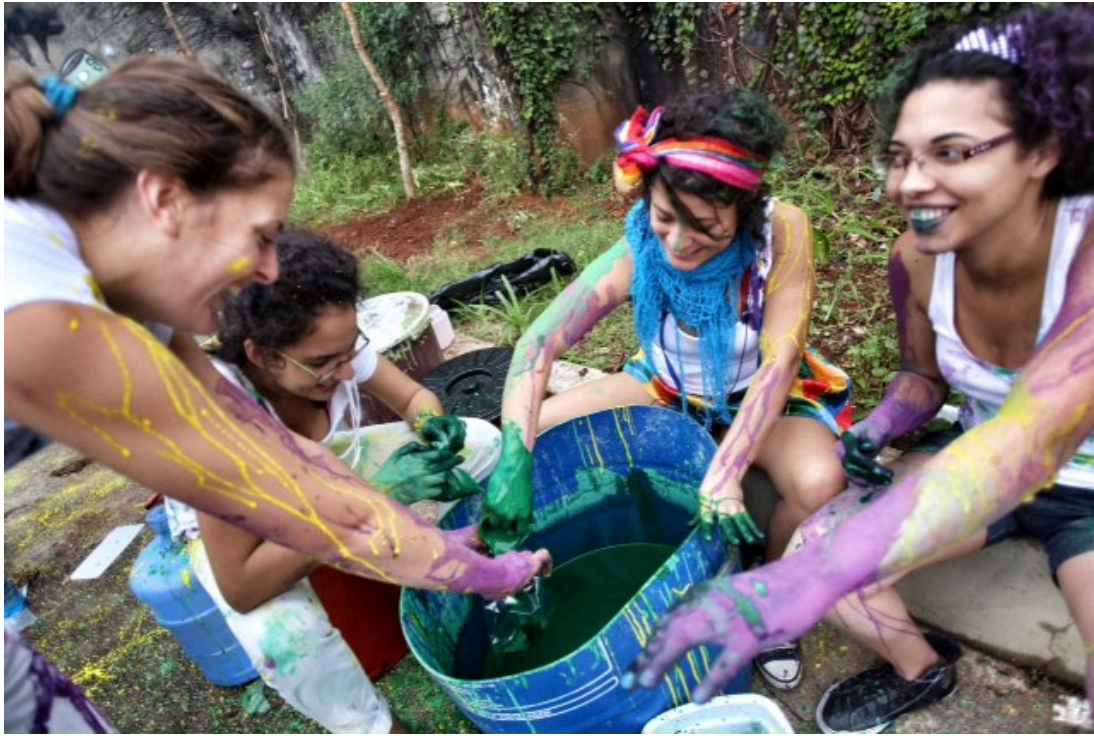
Figura 16. Divulgação.