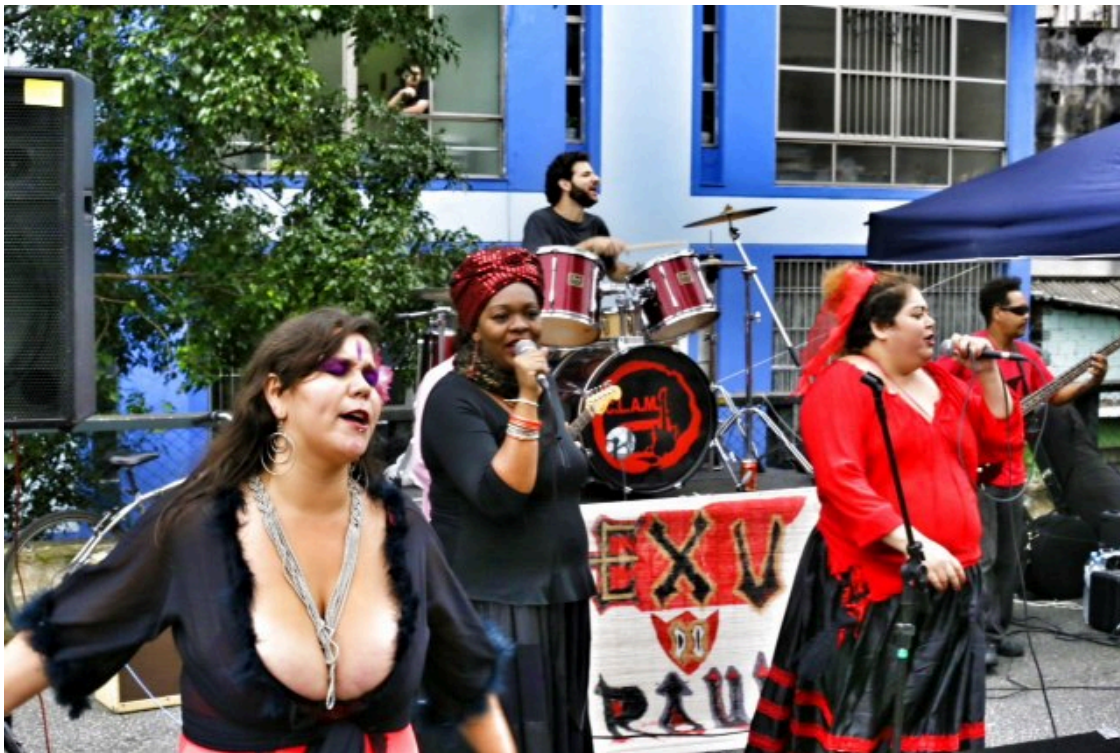
Figura 15. Divulgação. (Fonte: Creative Commons )