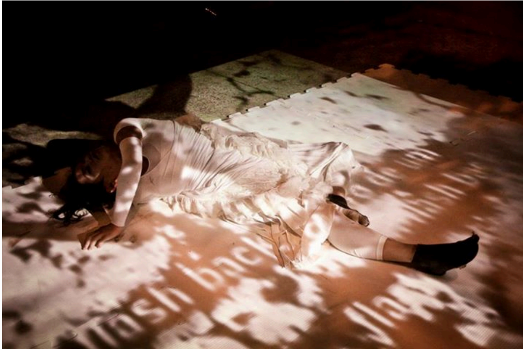
Figura 12. Divulgação. (Fonte: Creative Commons )