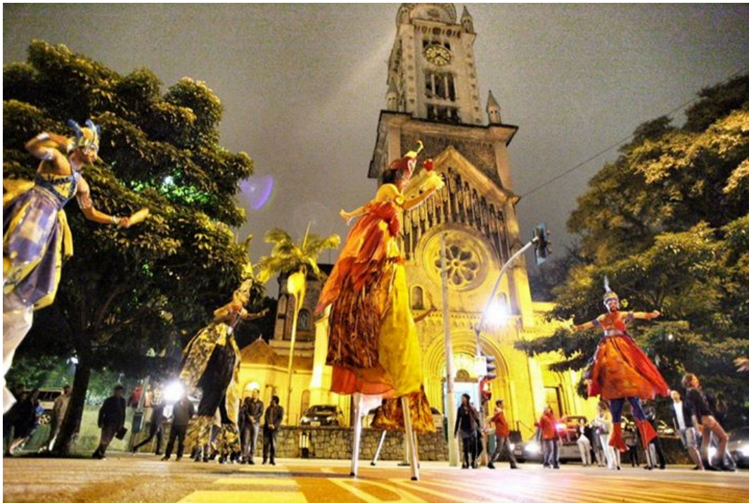
Figura 17. Divulgação. (Fonte: Creative Commons )