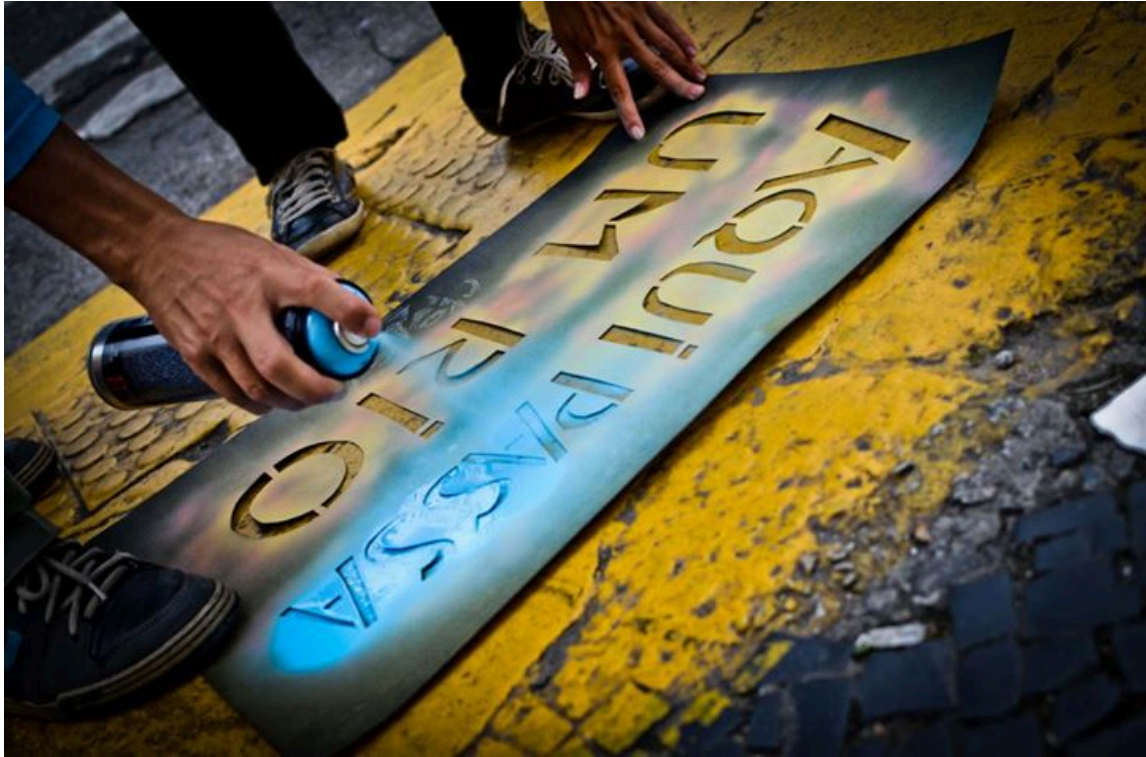
Figura 8. Divulgação. (Fonte: Creative Commons )