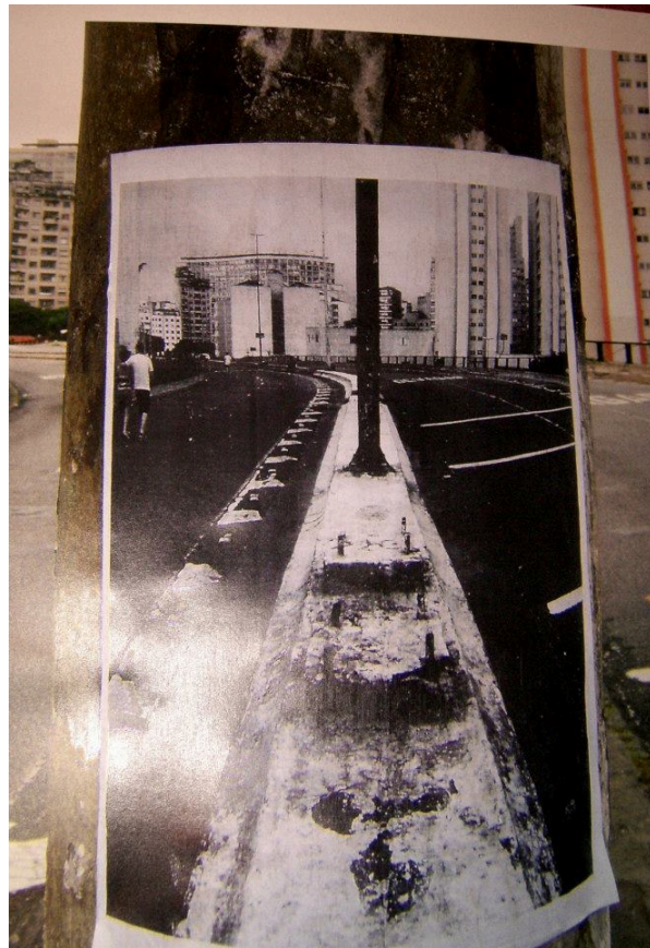
Figura 19. Divulgação. Festival Baixo Centro.