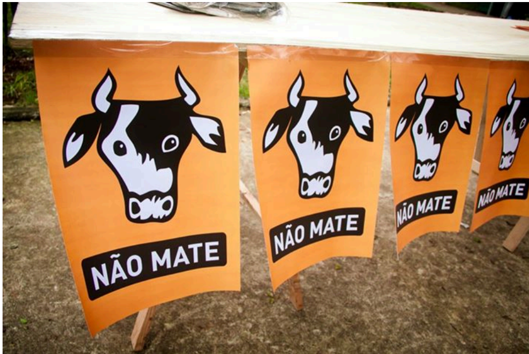
Figura 4. Divulgação.