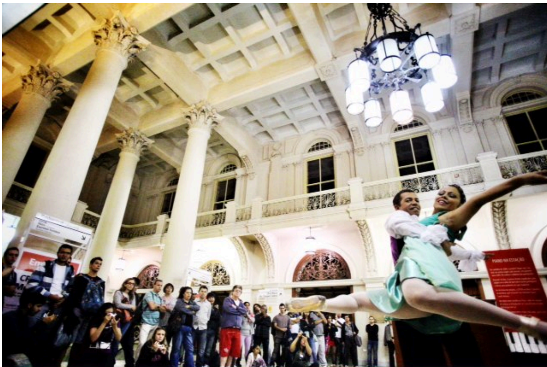
Figura 7. Divulgação. (Fonte: Creative Commons )