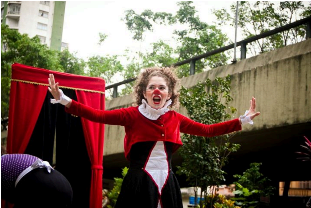
Figura 9. Divulgação.