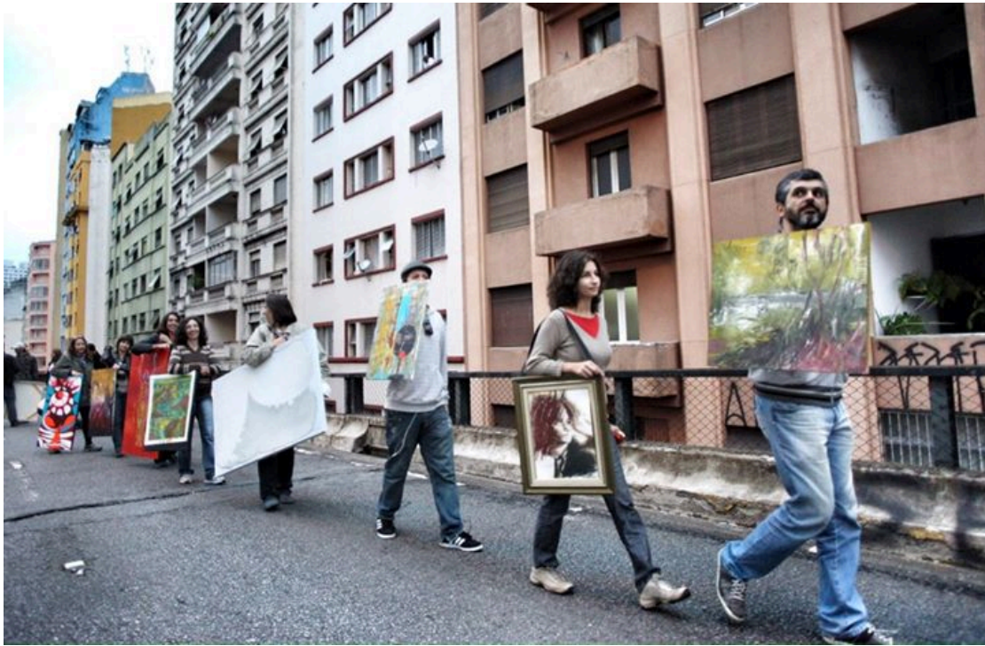
Figura 6. Divulgação.