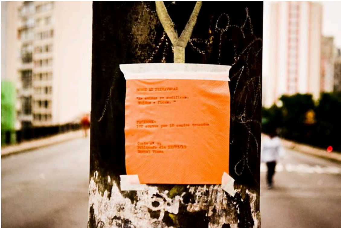
Figura 14. Divulgação. (Fonte: Creative Commons )