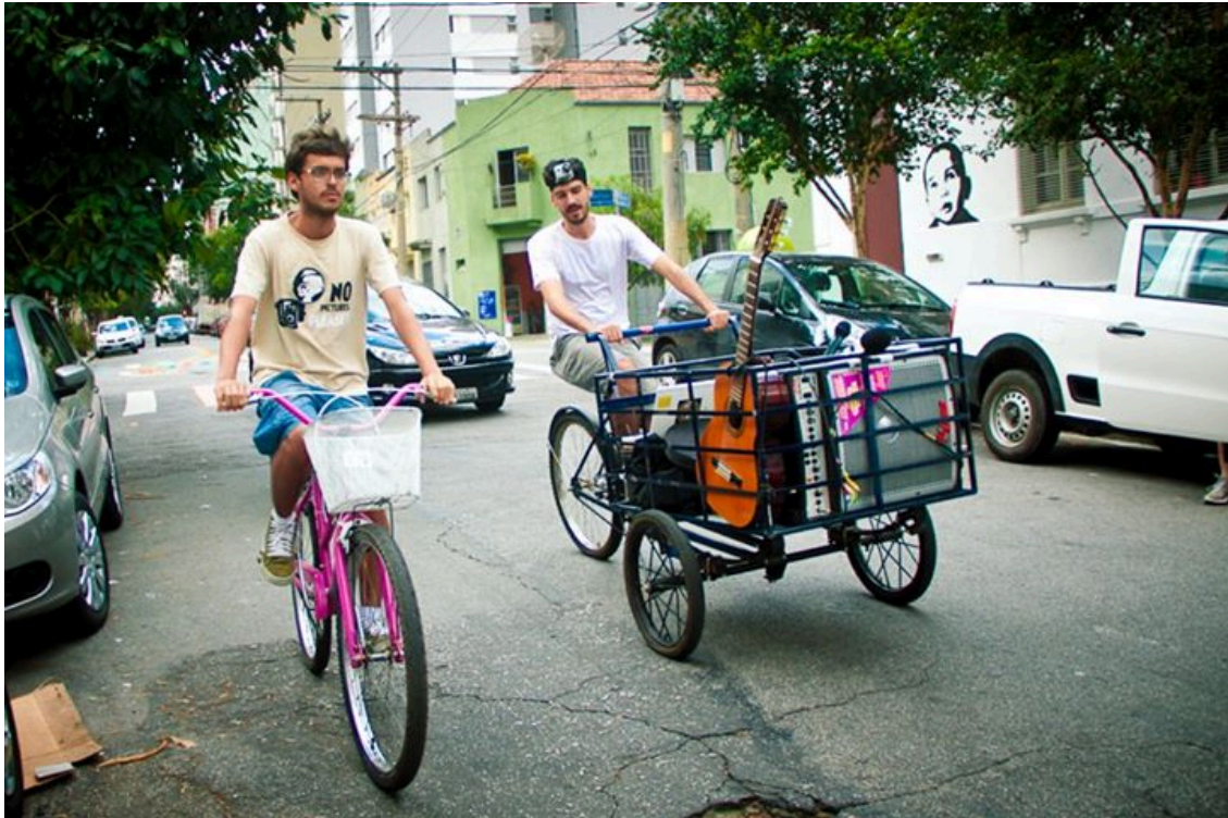
Figura 13. Divulgação. (Fonte: Creative Commons )