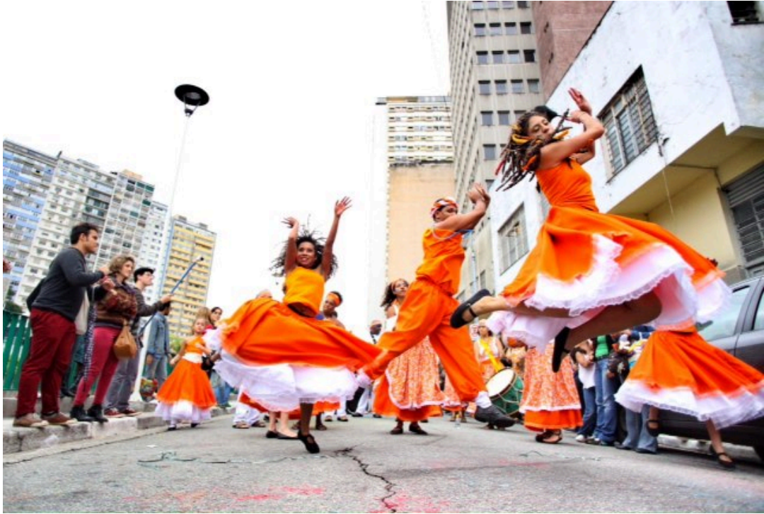
Figura 2. Divulgação.