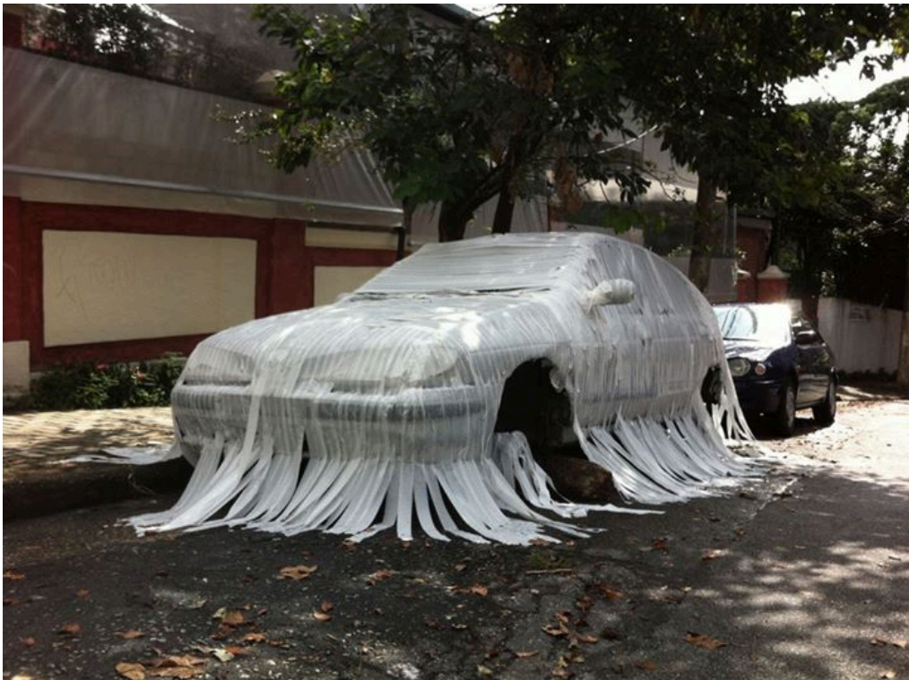
Figura 3. Divulgação. (Fonte: Creative Commons )