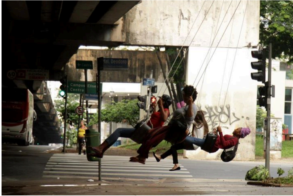
Figura 18.