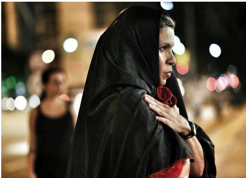
Figura 10. Divulgação. (Fonte: Creative Commons )