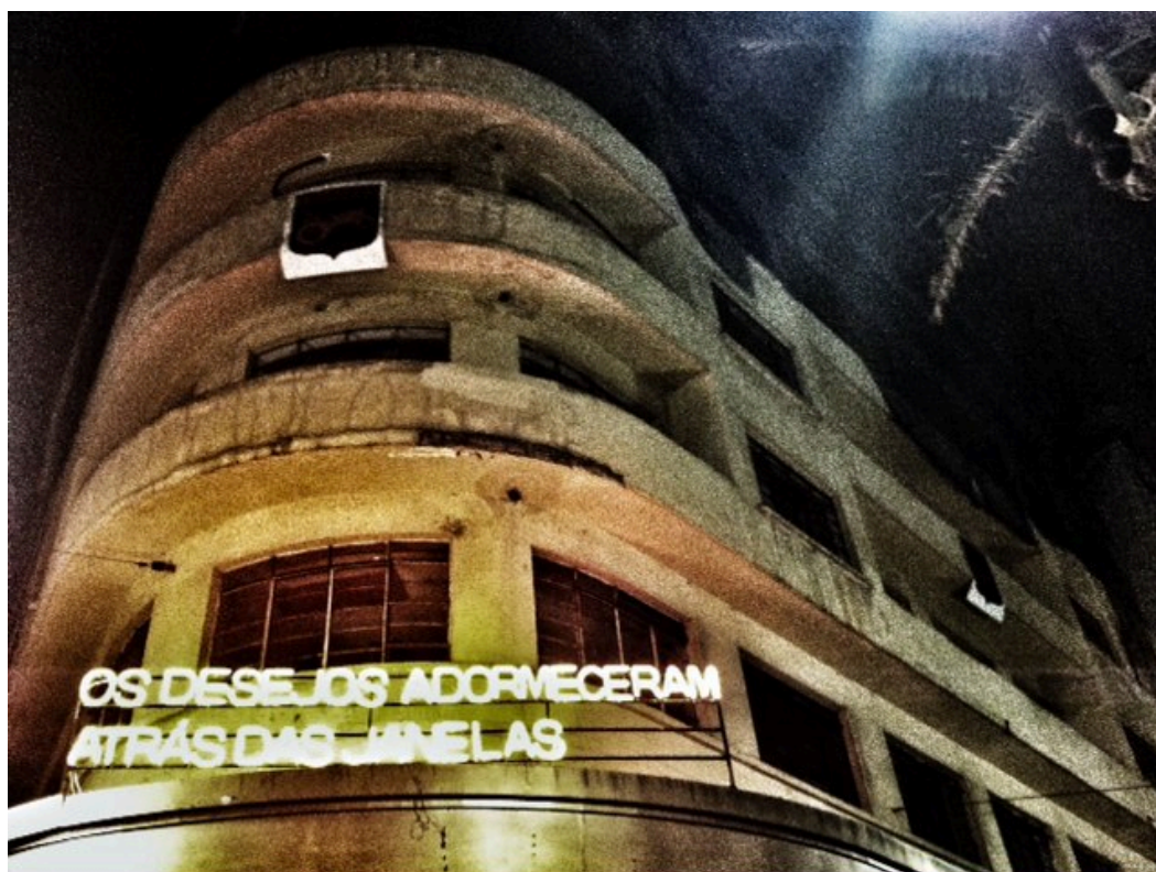
Figura 1. Divulgação. (Fonte: Creative Commons )

continuar punhetando (não entendam como algo ruim, tá?) ideias e conceitos e decidir se fazemos outro festival só em dezembro, como foi no ano passado? Vamos fazer mais ações pulverizadas no centro de São Paulo, colocando em prática o festival permanente? Vamos focar na Rede Livre BaixoCentro e realmente realizar o (meu) sonho de criar um laboratório de economia livre (principalmente do dinheiro ou algo que o valha)? Vamos nos associar a outros movimentos, entidades, ganhar corpo e ganhar dinheiro com o que já fazemos por ideologia (só para não deixar de fora nenhuma possibilidade, por mais impossível que seja)? O que vamos fazer? Para onde queremos olhar e andar? Qual a mensagem que queremos passar? Qual o trabalho que queremos fazer? Qual a mudança no mundo que queremos ser?