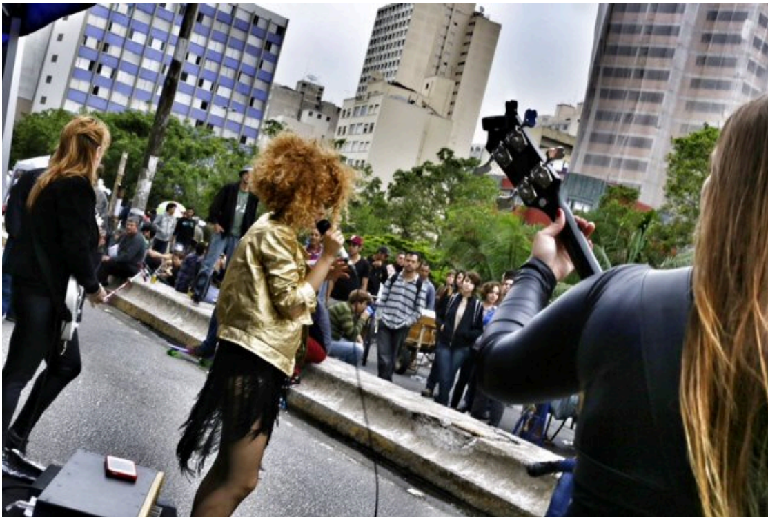
Figura 5. Divulgação. (Fonte: Creative Commons )