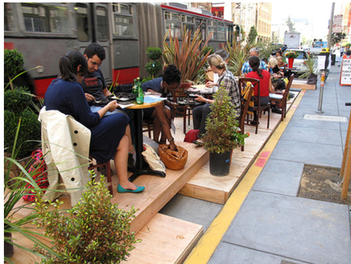
Figura 3. DIY (faça-você-mesmo) Urbanismo, SPUR, San Francisco. 4

O que eles estão procurando? Design urbano e sustentabilidade, amenidades da cidade, transporte público e bons espaços públicos lotados de pessoas diversas.