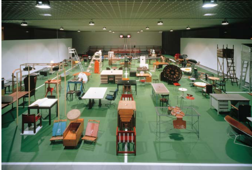
Figura 4. O Final Feliz de Amerika de Franz Kafka. Museu Boijmans Van Beuningen, Rotterdam, 1994, mídia mista, dimensões variáveis.

“O problema não é ser livre, mas achar uma maneira de sair...” (DELEUZE, GUATTARI, 1986, p.7-8)