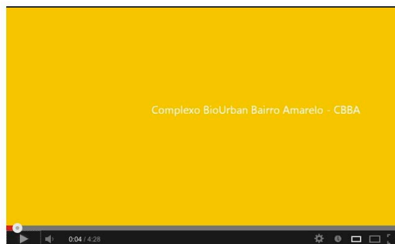
Figura 2. Unsolicited Urbanism, Hybrid Urbanism. BioUrban Complex, Bairro Amarelo, ressignificação do espaço. São Paulo. Jeff Anderson e Biourban. (Vídeo disponível em: http://www.youtube.com/watch?v=BADKZF5o7OU )

Emerge um poder contagiante de reinvenção nesses grandes aglomerados urbanos. As pessoas e as cidades que estão sendo redescobertos de forma criativa e inovadora, reconstruindo o seu destino depois de períodos de declínio e gerando situações híbridas contaminadas por antigas condições pré-existentes e as emergências do novo: oportunidades, programas, eventos, pessoas.