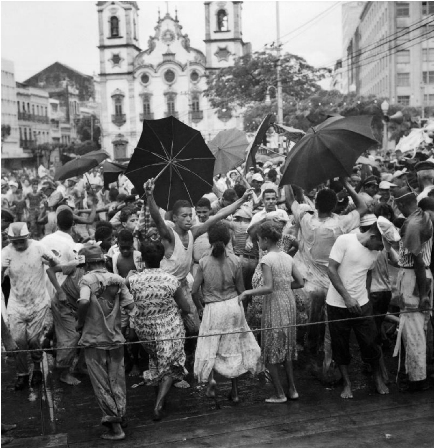
Fig. 4: Carnaval de rua em frente à Igreja Matriz do Santíssimo Sacramento de Santo Antônio. Fonte: Marcel Gautherot – Acervo IMS, 1957.

Uma década depois, o carnaval na Pracinha era novamente objeto de registro fotográfico, agora através das lentes de Gautherot, como vemos na figura 4: Matriz de Santo Antônio ao fundo e à frente, em primeiríssimo plano, talvez ao som de “Evocação” (FERREIRA, 1957), a janela fotográfica aberta por Gautherot mostra um cordão, em cujo lado de lá se pode ver o piso da rua onde o carnaval participante se assenta, enquanto do lado de cá a passarela de um carnaval espetáculo revela-se no tabuado que cobre o piso da rua. De acordo com Lima (2018, p. 230), nos anos 1950, o carnaval se institucionalizava, passando a ser responsabilidade do poder público municipal e, enquanto tal, perdia muito do seu caráter livre. Ainda é Lima (2018, p. 226) quem afirma serem os anos 1960 aqueles em que imperava a disputa entre dois tipos de festa que nos fins da década anterior, apresentava-se no Recife: os carnavais espetáculo e participação.