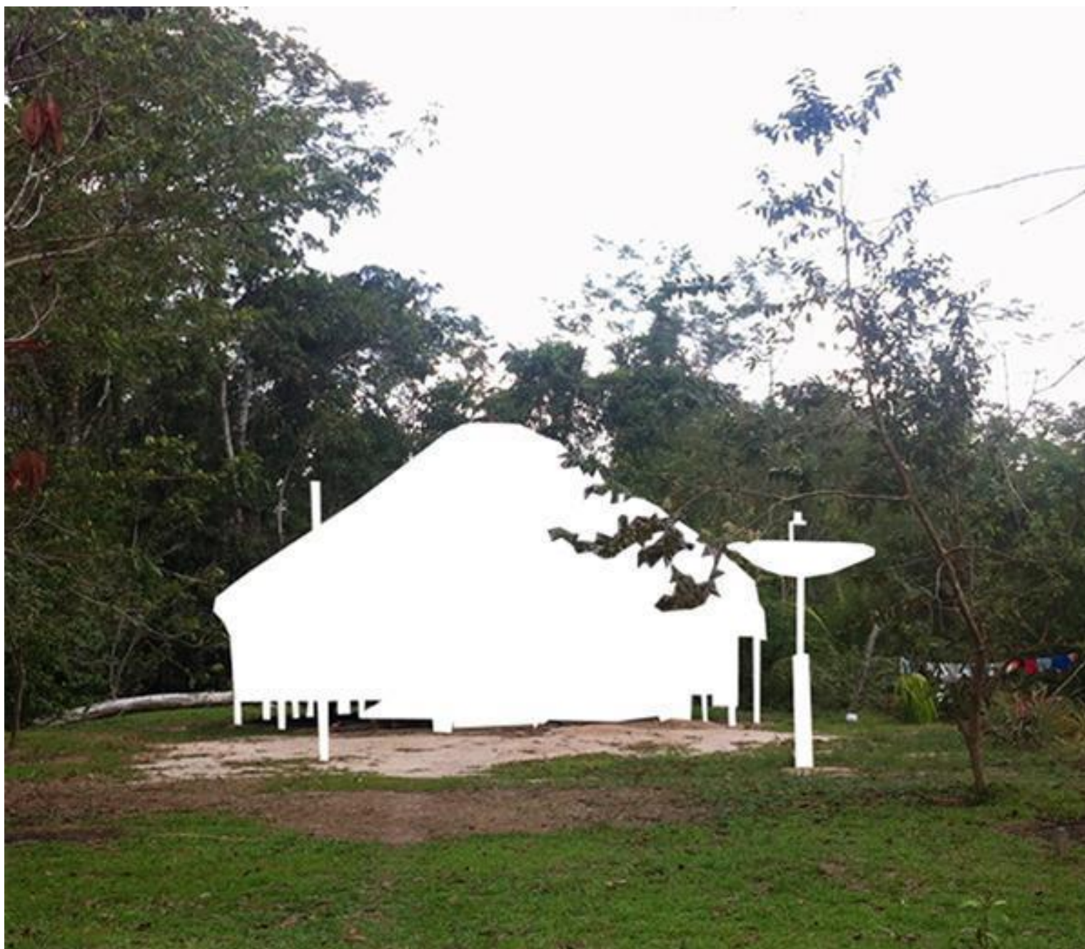
Fig. 10: Registro fotográfico de una casa de planta circular en Mutum.

Articuladas a las narrativas históricas de los Yawanawá, las líneas investigativas arqueológicas recientes confirman la existencia de una infraestructura materialmente edificada en el paisaje amazónico, como son los innúmeros terraplenes, canales, caminos, sendas, etc., que fueron trazados por los pueblos amerindios, con sus técnicas y saberes ancestrales. En esta Arquitectura-Floresta, la tierra es la materia prima y, recientemente, debido al avance de las sofisticadas técnicas de análisis cartográfico, vía satélite, se han podido revelar los vestigios y visualizar ruinas ocultas bajo la mata de la Floresta Amazónica. Estas formaciones arquitectónicas e infraestructurales, que durante décadas fueron consideradas espacios naturalmente constituidos, son el resultado de procesos constructivos amerindios y, por tanto, es necesario reivindicarlas aquí como formas contra hegemónicas de arquitectura cuyo proyecto es construir Floresta. Estas conformaciones materiales también expresan la resistencia de los pueblos indígenas en la contemporaneidad, que preservan y reinventan sus prácticas ambientales, ecológicas, energéticas, sociales, políticas, etc.