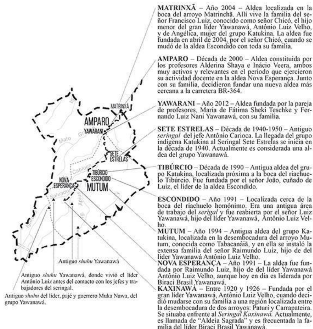
Fig. 1: Diagrama de las aldeas en la Tierra Indígena Rio Gregorio (TIRG) registradas en 2016.

Desde hace algunas décadas, la población Yawanawá recibe en sus aldeas a visitantes interesados en sus saberes medicinales y culturales, lo que ha provocado una serie de transformaciones espaciales y arquitectónicas en la TIRG. Este grupo de mujeres —a pesar de estar inseridas en una región inmersa en el proceso de la urbanización planetaria 5 (Mendo, 2018)— mantienen y defienden sus saberes ancestrales tradicionales, entre los cuales, el saber espacial de diseñar el paisaje que habitan. A mi llegada en Mutum, conforme la cartografía que se visualiza en la Figura 2, la cacique de la aldea expresó su interés en la idealización y ejecución de varios proyectos arquitectónicos y manifestó su deseo de construir espacios que expresasen la metamorfosis de la cultura indígena material, entendiendo la importancia de consolidar ciertos conocimientos técnicos constructivos nativos que permitiesen la autoconstrucción y autogestión de los espacios. En sus propias palabras, no se trataba de “construir una casa con forma de cabaña”, y si de buscar el lugar de la arquitectura Yawanawá en la contemporaneidad.