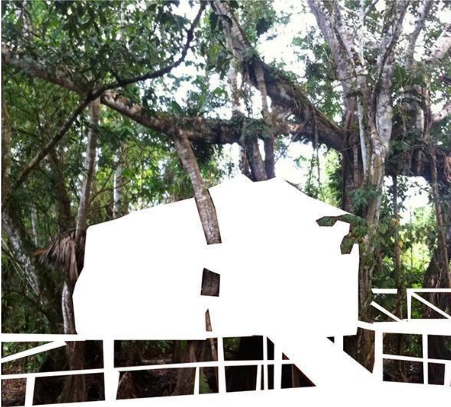
Fig. 9: Registro fotográfico de una vivienda entre los árboles en la aldea Mutum.