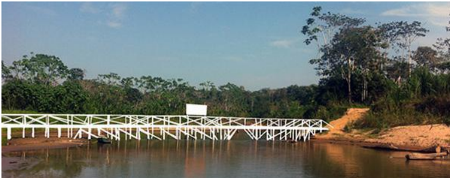
Fig. 12: Registro fotográfico del puente construido por los Yawanawá en la aldea Mutum.