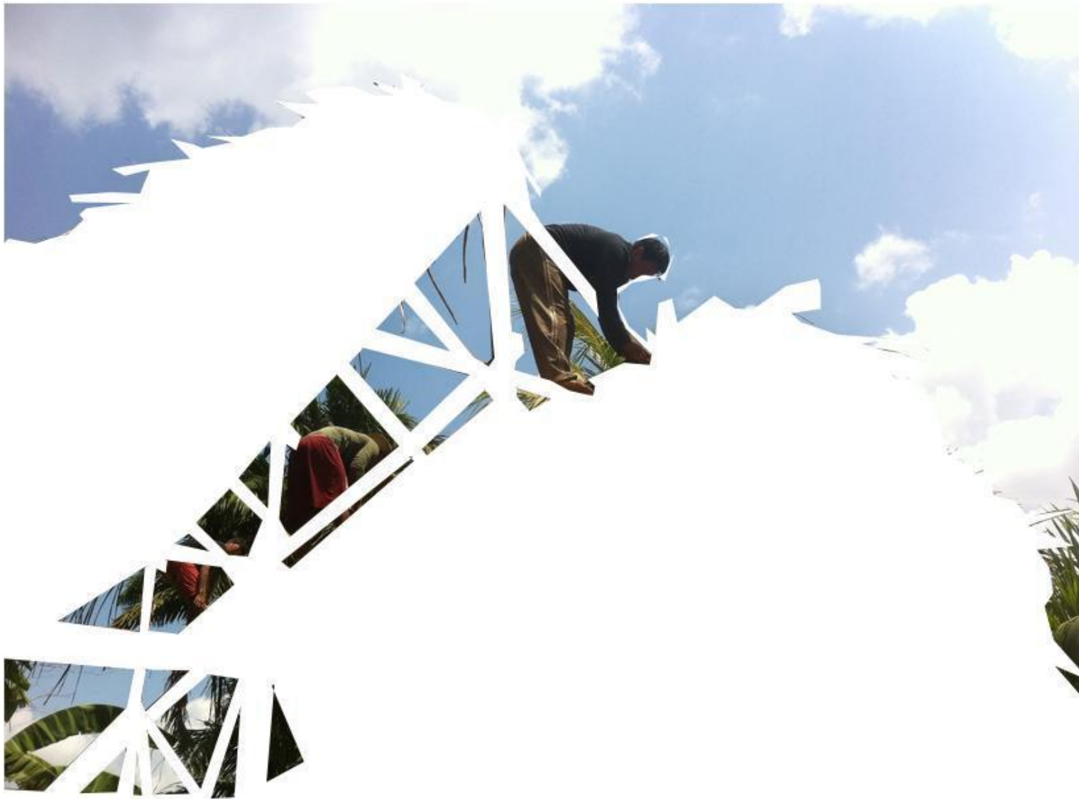
Fig. 7: Registro fotográfico de una casa en construcción en la aldea Mutum.