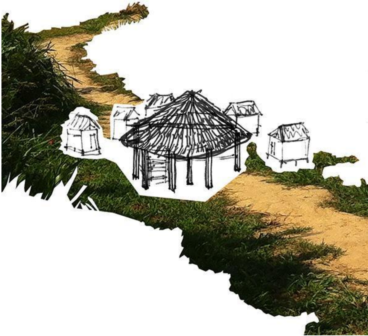
Fig. 4: Registro gráfico del Centro de estudios Yawanawá de la aldea Mutum.