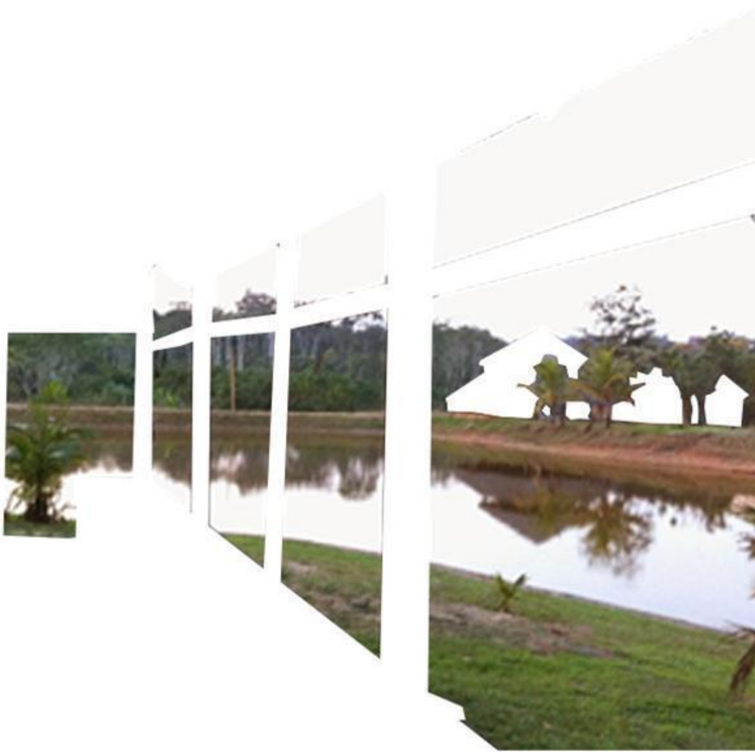
Fig. 8: Registro fotográfico de una casa construida cerca del açude en la aldea Mutum.

Como arquitectos y urbanistas participamos del montaje colectivo de contra-narrativas que, entrelazadas, formulan perspectivas de lectura, comprensión y reinterpretación del territorio. Al ser partícipes de la reconstrucción y rearticulación entre nexos, tiempos y otras constelaciones posibles de memorias históricas apagadas o silenciadas debemos permanecer atentos a la incorporación y escucha de otras voces y cosmovisiones, incluyendo aquellas que habitan extramuros de la academia. Y, en este sentido, experimentar metodologías para ejercitar el pensar y practicar juntos, que implica desjerarquizar las relaciones clásicas de la producción de conocimiento científico y ampliar los caminos que legitiman otros saberes (Viveiros de Castro, 2018). Esto implica practicar gestos y movimientos en pro de una acción metodológica descolonizadora que nos (re)sitúe frente a nuestros interlocutores y sus inteligencias de forma horizontal, ensayando y experimentando otros lenguajes y medios de aproximación.