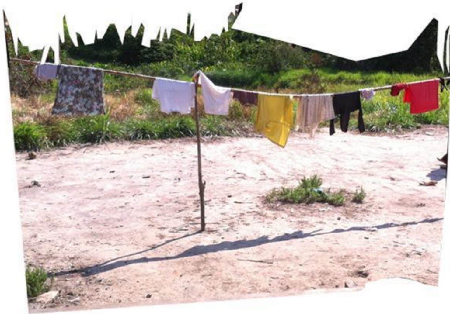
Fig. 11: Registro fotográfico de la entrada de una vivienda en la aldea Mutum.

Con esta serie de documentos visuales y/o montajes impuros, se trata de manifestar y reivindicar que la construcción de esta Arquitectura-Floresta es producto de una agenda amerindia de coexistencia con el paisaje diseñada colectivamente e intergeneracionalmente. Así, se afirma visualmente, mediante la secuencia de fragmentos recortados, que la arquitectura amerindia amazónica revela, como patrimonio, un amplio abanico de técnicas y saberes para construir tierra, nutrir suelos, generar otras especies, producir abundancia botánica y significados propios en sus prácticas de acción-producción de espacios. El paisaje construido por los pueblos amerindios, conforme se presentan en las Figuras 12 y 13, aquí está siendo reivindicado como una práctica espacial proyectual, ya que sus saberes constructivos, técnicos y materiales fueron y son, activados y transmitidos, formulando las condiciones de proyecto de una Arquitectura contra-hegemónica, cuyo nombre es Floresta.