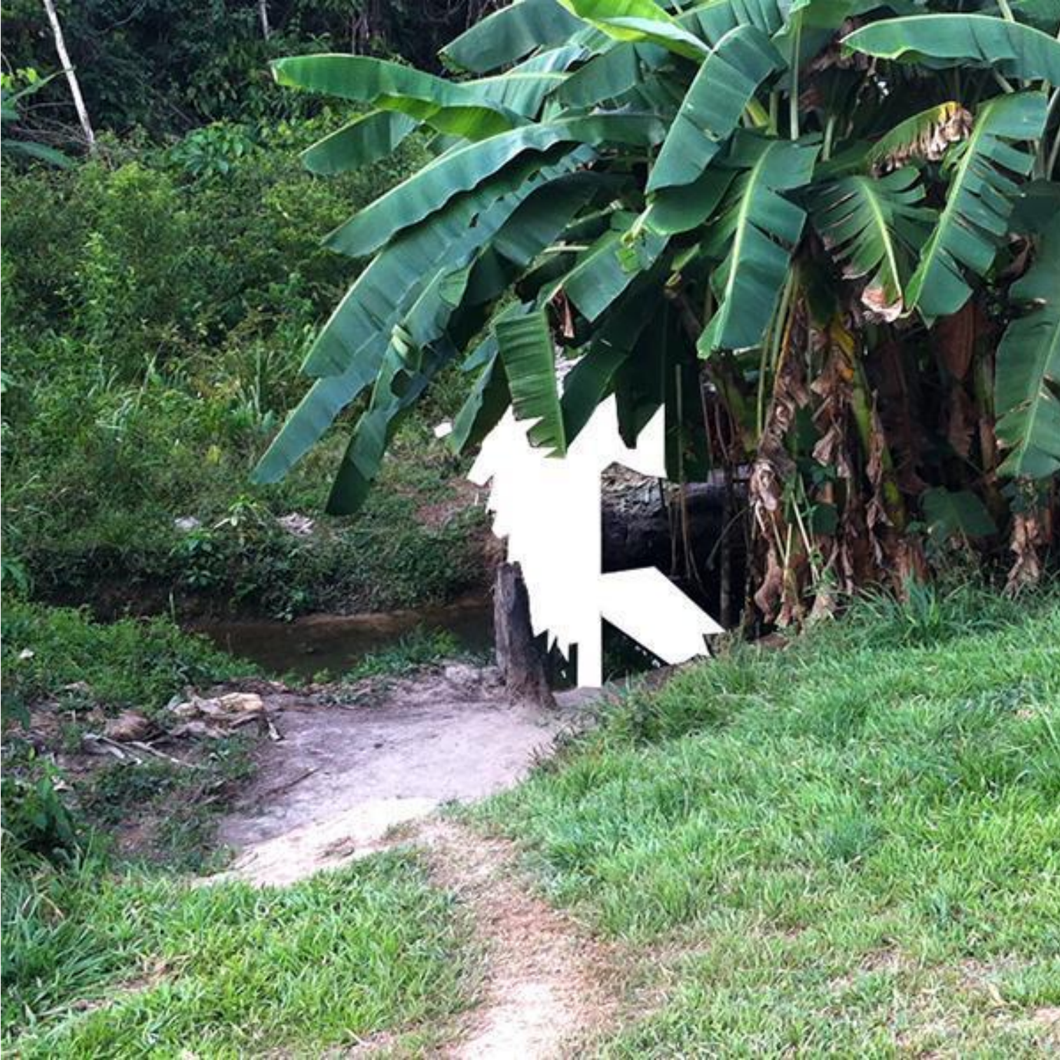
Fig. 13: Registro fotográfico de la estructura de apoyo del igarapé Mutum.