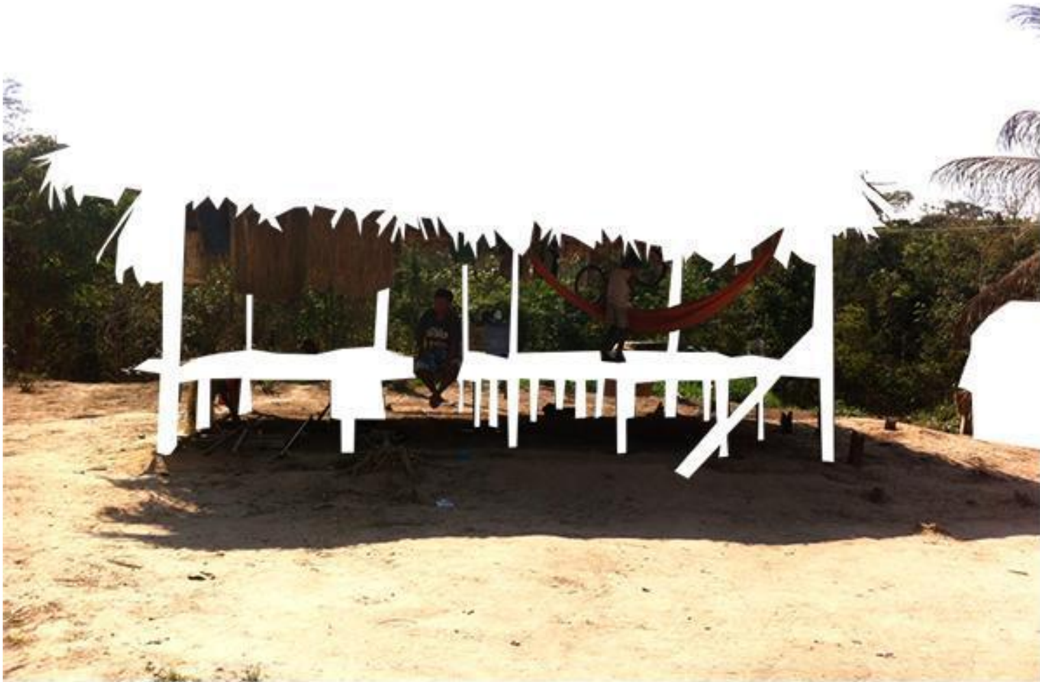
Fig. 6: Registro fotográfico de una casa en construcción en la aldea Mutum.

instrumento de producción de ideas y pensamientos en el ámbito de las arquitecturas contra-hegemónicas. Esta pesquisa visual anhela abrir un debate académico, investigativo y experimental que considere activos e influyentes los saberes y prácticas amerindias dentro de la producción del paisaje y de la arquitectura contemporánea.