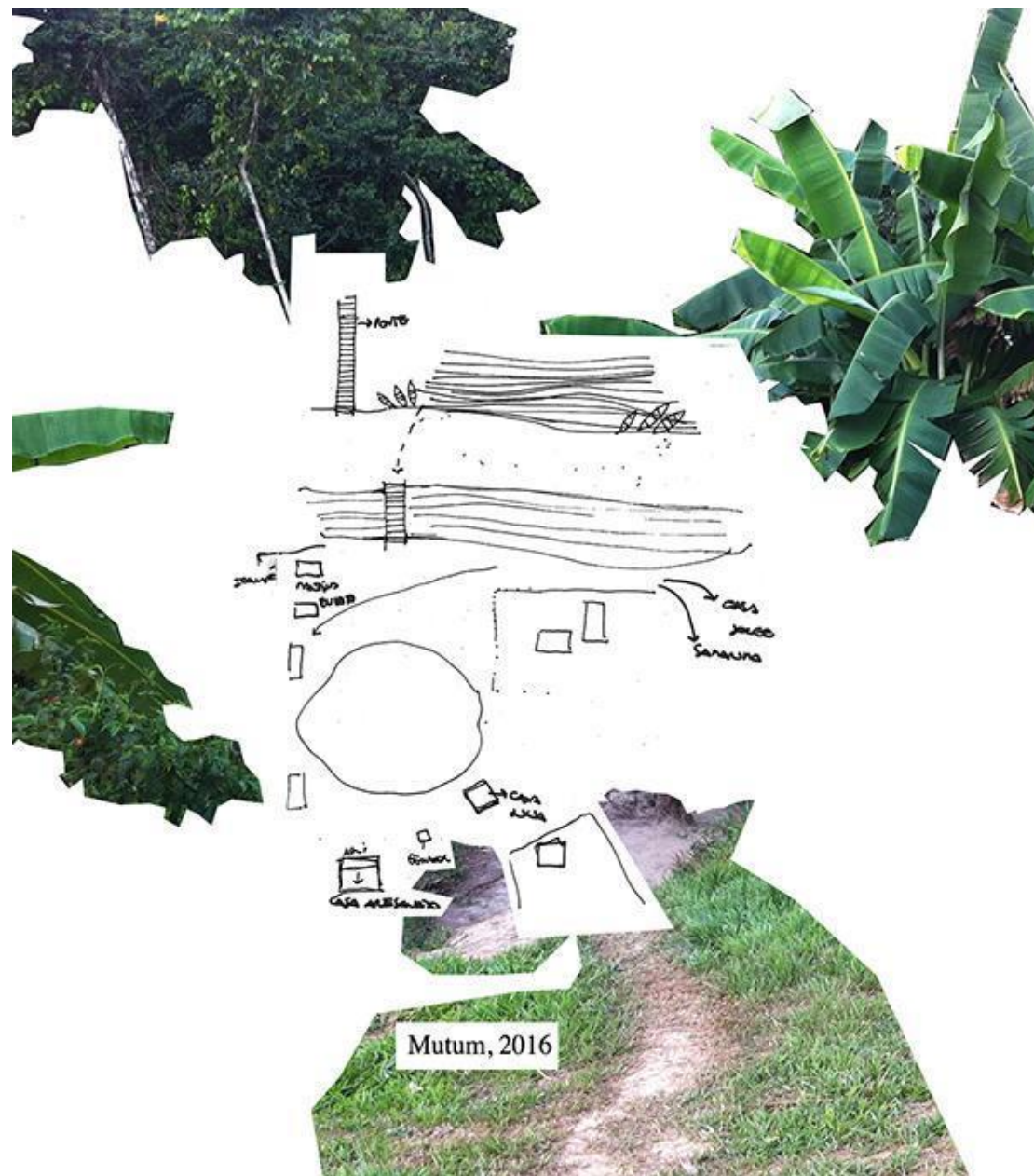
Fig. 2: Llegada en barca en la aldea Mutum.

La convivencia con la población en Mutum fue cotidiana y la comunicación se realizó por mediación de la cacique y un grupo de mujeres que frecuentaban diariamente su casa: la hermana, la cuñada y la profesora Yawanawá de la escuela infantil. La relación con este pequeño grupo y otras mujeres próximas a ellas fue estrecha, ya que realizábamos las actividades colectivas 6 en un espacio abierto construido por la cacique, que se configuraba como una extensión de su propia casa. Este espacio albergaba, a lo largo del día, grupos de personas de todas las edades, lo que propició, de forma espontánea, la multiplicación de encuentros, relatos y algunos dibujos —realizados a partir de estas sinergias. A partir de ese diálogo surgieron los primeros esbozos del lugar, realizados en mi cuaderno de campo in situ y las fotografías de las espacialidades indígenas —que componen los documentos base de este ensayo.